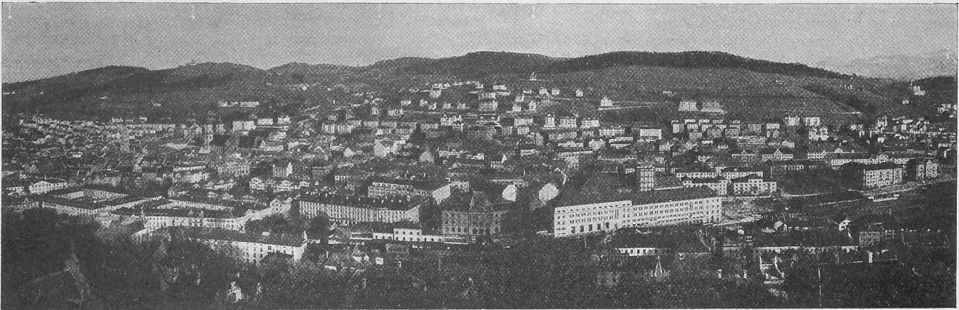
Abb. 1. Ansicht von St. Gallen mit dem Wettbewerbsgebiet vom gegenüberliegenden Hang des Rosenberges.

„Rudolf Gelpke“ und „Fendel 22“ die Rückreise nach Basel anzutreten und unterwegs die Augster Schleuse und die Kraftwerke Augst-Wyhlen, sowie in Basel die Hafenanlagen zu besichtigen. Ein einfaches Abendessen soll die gemeinsame Tagung beschliessen.