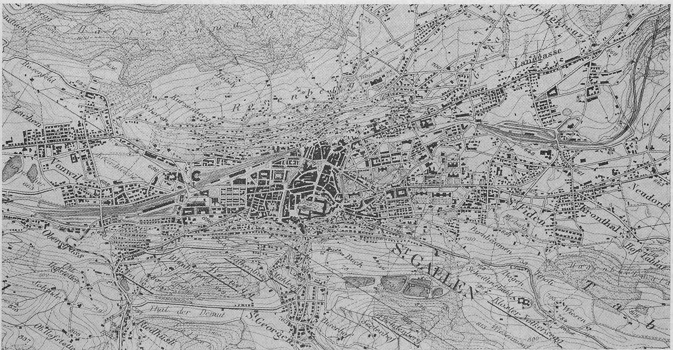
Abb. 2. Uebersichtsplan der Stadt St. Gallen und Umgebung. — 1:25 000. — Mit Bewilligung der Schweiz. Landestopographie vom 18. VII. 1913.

Durch den Wettbewerb sollen für die gegenüber dem Rosenberg ziemlich steil nach der Stadt zu, gegen Nordwest abfallenden, grossenteils noch unbebauten Hänge (Abb. 1 und 2) geeignete Ueberbauungs-Vorschläge gewonnen werden. Die Aufgabe ist eine dreifache; sie besteht erstens im Studium eines zweckmässigen Strassennetzes, zweitens im Studium der Ueberbauung und drittens im Studium eines Baureglements, das die möglichste Einhaltung der als wünschenswert erachteten Bauweise gewährleistet. St. Gallen besitzt eine Zonenbauordnung mit vorläufig vier Zonen; das dem Wettbewerb unterstellte Gebiet soll als fünfte Zone dem Wohnbedürfnis des Mittelstandes in Einzel-, Gruppen- und Reihenhäusern nutzbar gemacht werden. Es soll, und darauf legt die ausschreibende Behörde grossen Wert, studiert werden, wie nach Höhe, Gruppierung, Gebäudestellung zu den Strassen die Uebelstände vermieden werden