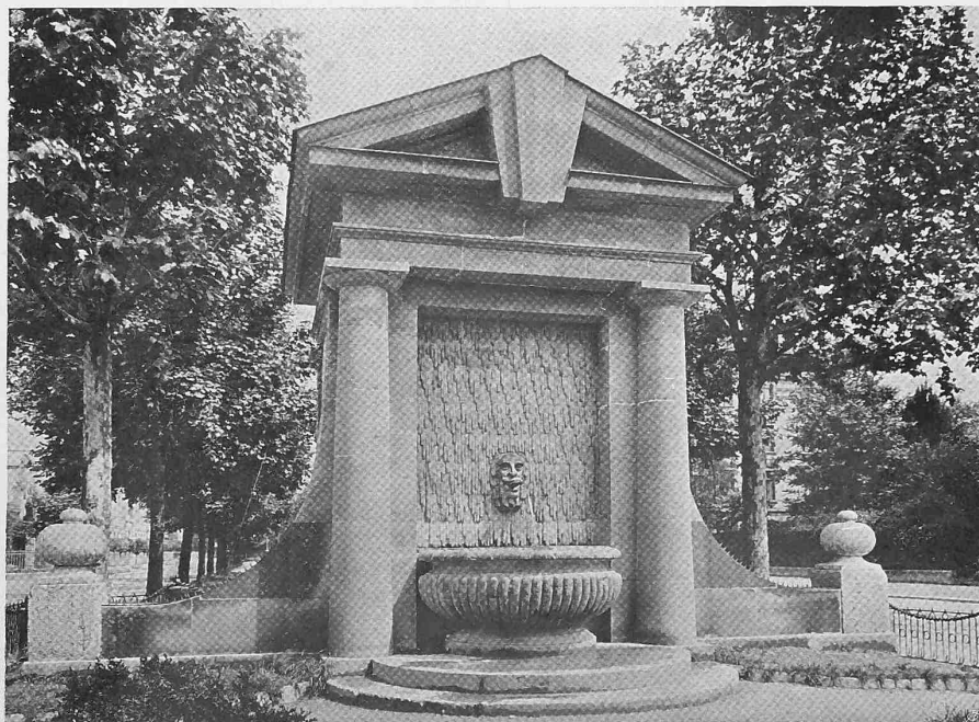
Oben: Gegen die Anlage