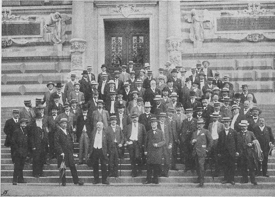
Eine Gruppe von Teilnehmern an der Generalversammlung des S. I. & A. V. vor dem Palais de Rumine nach Schluss der Sitzung vom 24. August 1913. 1)

Stromabgabe der Elektrizitätswerke für Heizzwecke. Die grösseren Elektrizitätswerke, wie beispielsweise auch das stadt-zürcherische und das kantonale-zürcherische Elektrizitätswerk, pflegen seit einiger Zeit eine äusserst intensive Propaganda, um, in Verbindung mit einer Gewährung von Spezialrabatten, bei den Abonnenten elektrischer Energie die Einführung von elektrischen Heizapparaten für Gewerbe und Haushalt in grösserem Masse zu bewirken. Dabei handelt es sich neben Wärmeapparaten und Kochern der verschiedensten Art vornehmlich um Bügeleisen, Backöfen für Brod und Patisseries, Bratöfen u. a. m. Einen erheblichen Aufschwung in der Stromabgabe für Heizzwecke haben, nach einer bezüglichen Notiz in „Elektrische Kraftbetriebe und Bahnen“, namentlich amerikanische Grosstadt-Elektrizitätswerke aufzuweisen. In dieser Notiz vernehmen wir nämlich, dass beispielsweise in New York die Edison-Gesellschaft im Jahre 1900 an Heizapparaten einen Anschluss von nur etwa 200 kw aufzuweisen hatte, während derselbe heute auf etwa 3000 kw angewachsen ist. Von ähnlicher Grösse ist der Aufschwung, den die Edison-Gesellschaft für Heizapparate in Chicago zu verzeichnen hat. Interessant sind für die beiden amerikanischen Grosstädte auch die Angaben hinsichtlich der gewerblichen Verwendung elektrischer Heizapparate. So haben beispielsweise die Bügeleisen in Schneiderwerkstätten, Lakieröfen in Maler-