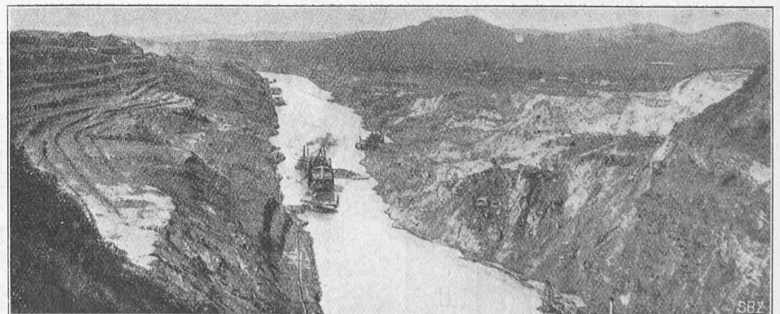
Abb. 2. Blick vom Contractors Hill gegen NW., im Oktober 1914