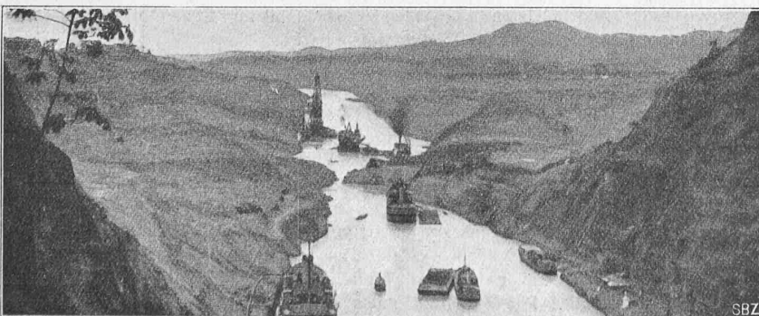
Abb. 3 wie Abb. 2, aber im August 1915, mit beidseitigen Rutschungen.

Der erste „Bruch“ im Culebra-Gebiet wurde im Jahre 1907 beobachtet. In rascher Aufeinanderfolge ereigneten sich dann Ende 1910 zwei weitere Brüche, die die Arbeiten ernstlich störten. Als Vorbeugungsmassregel gegen eine Wiederholung derartiger Vorfälle wurde nach Prüfung durch einen Geologen eine Entlastung der tieferen Schichten unter den beidseitigen Böschungen durch teilweises Abtragen der überlagerten Erdmassen beschlossen. Im Kurvenplan Abbildung 1 gibt die vollausgezogene Linie die äusserste Grenze, bis zu der nach Ansicht des Geologen Rutschungen zu befürchten waren, die gestrichelte Linie die bei der Abtragung von den Dampfschaukeln erreichte Grenze. Dieser Aushub erfolgte