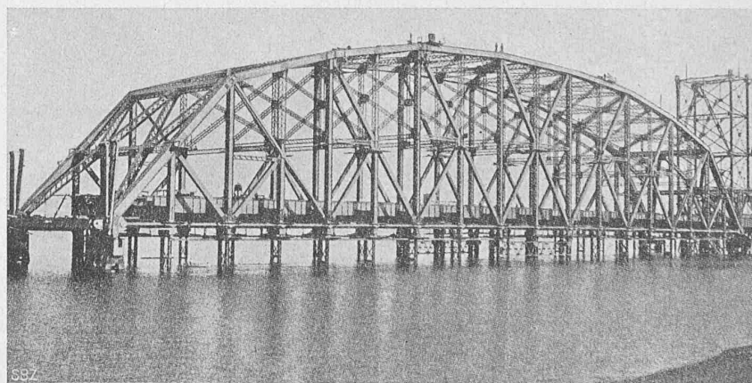
Einhängender Mittelträger der Quebec-Brücke, auf dem Montagegerüst (Nach „Eng. News“ v. 24. Aug. 1916).