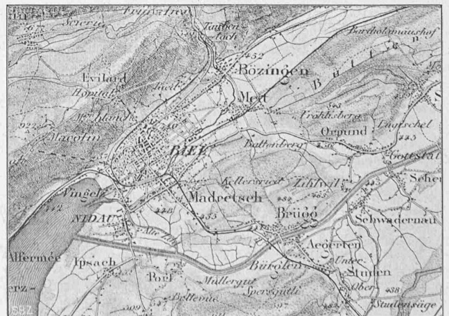
Abb. 1. Uebersichtskarte von Bözingen und Umgebung. — Masstab 1 : 100 000. Mit Bewilligung der Schweiz. Landestopographie vom 25. Oktober 1916.

befinden. Im Gange befindliche Versuche mit verfeinerten Einrichtungen, über die wir in Bälde berichten zu können hoffen, bestätigen mit aller wünschbaren Deutlichkeit die Existenz der neuen kritischen Geschwindigkeit.