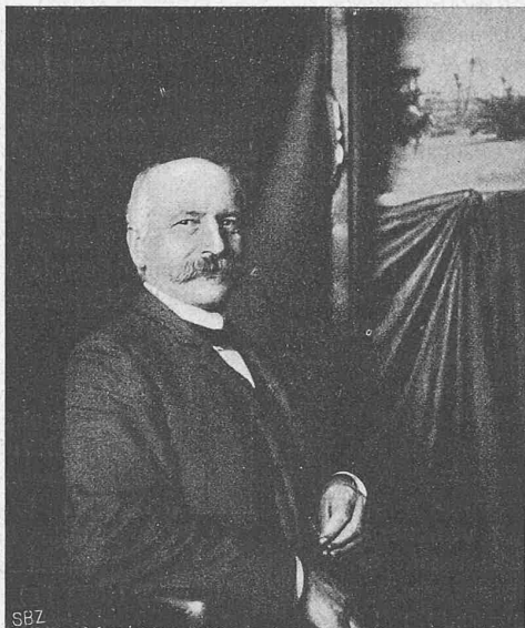
A. Chiodera Architekt

Linth-Limmatverband. Am 26. November hat sich in Rapperswil der Linth-Limmatverband konstituiert. Nach dem bei der