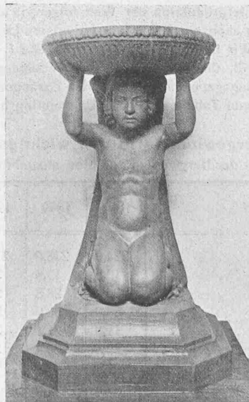
Abb. 6 und 7. Taufstein, entworfen und ausgeführt von H. Markwalder, Zürich.