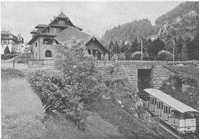
Abb. 6. Station Seelisberg der Treib-Seelisberg-Bahn.

jenes von Sändli (beim Rütli) nach Seelisberg-Sonnenberg. Seit 1905 war die Gemeinde Seelisberg im Besitze einer Konzession für eine Zahnbahn von Treib nach Seelisberg. Diese Projekte wurden indessen zum Teil aus Rücksichten der Pietät wegen der historischen Stätte des Rütli nicht konzessioniert und teils, wie das Zahnbahnprojekt, zufolge