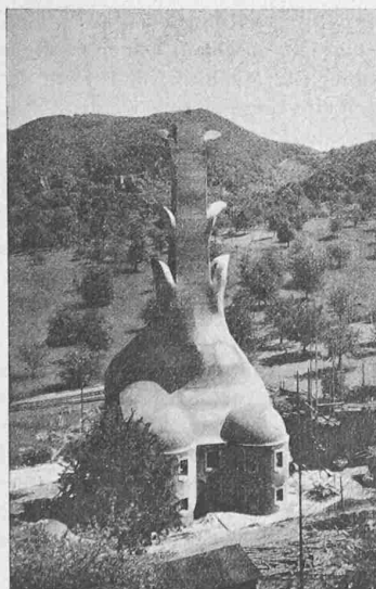
Abb. 4. Kesselhaus der Zentralheizung.

Mit Rücksicht auf die grosse Bedeutung, die in den letzten Jahren die genannte Antriebsart für Schiffe auch grösseren Tonnen-