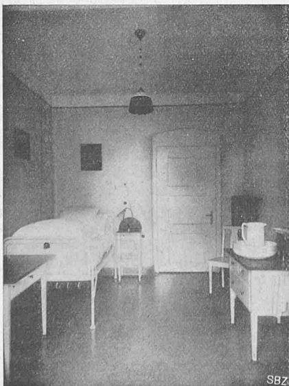
Abb. 12. Einzelzimmer.

mit Dampf betrieben. Sonnerie, zentrale Uhrenanlage und Haus-telefon vervollständigen die Inneneinrichtung. Die elektrischen Leitungen sind unter den Putz verlegt, jene für die Heizung und sanitären Einrichtungen in besondern Mauer-schlitz-ven verdeckt angeordnet.