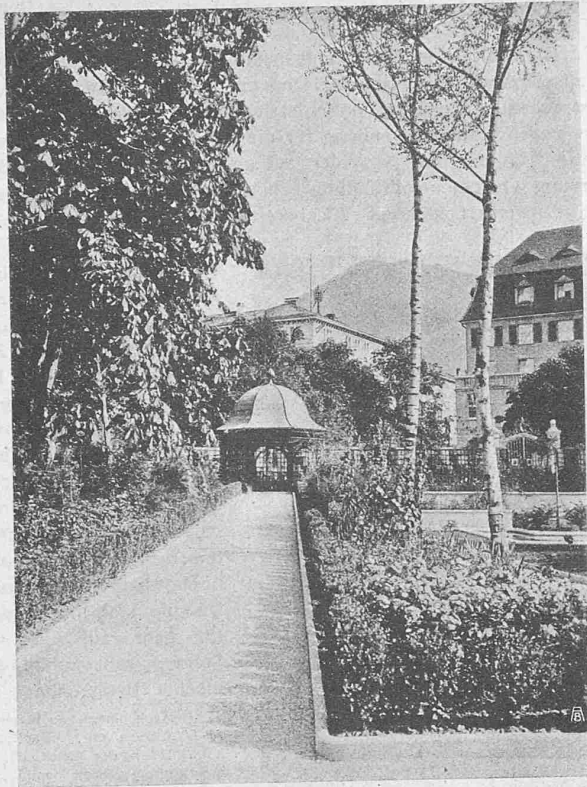
Abb. 3. Aus dem Garten Callisch in Chur (Text vergl. Seite 300).

ist aber bei der Aufstellung des Systems unterlassen worden, die Grösse dieses Spielraumes endgültig und auf praktische Art zu bestimmen. Sie kann variieren zwischen \frac{1}{16} und \frac{1}{24} der theoretischen Gewindetiefe; daher die grosse Mannigfaltigkeit in den Kerndurchmessern der verschiedenen Werkzeugfabriken. Ist diese Gewindetiefe schon ein Mass, das an der Schraube selbst nicht gemessen werden kann, so ist natürlich ein Bruchteil derselben die denkbar ungeeignetste Abmessung für die Verwendung in der Werkstatt.