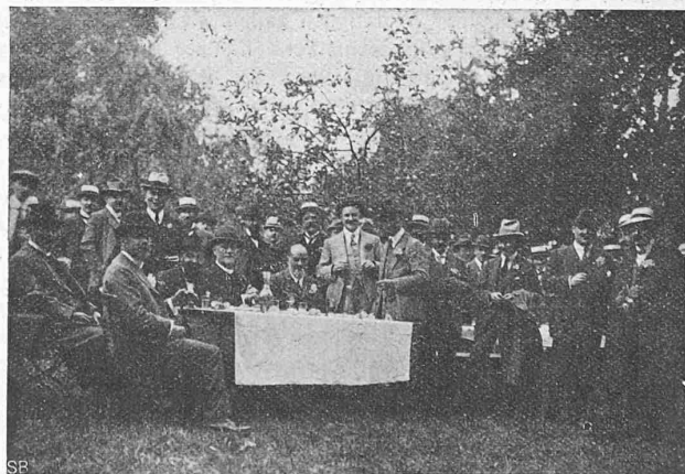
Abb. 2. (Erster) Frühschoppen an der Aare bei der Neubrücke.