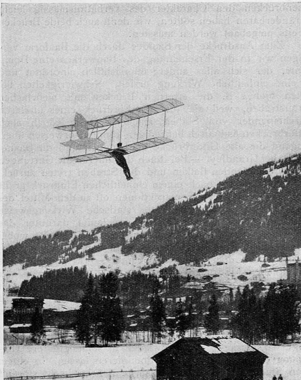
Abb. 2. Das Doppeldecker-Gleitflugzeug von Chardon im Flug.

gut geworden war, suchten die Wrights neue Wege und gelangten so zu den ersten gelungenen Flügen mit Windenergie als alleiniger Kraftquelle. Die riesige Entwicklung des Motorflugzeuges erstickte aber bald den neuen Ansatz, bis in Deutschland unter dem Zwange der Not — dem Ententebauverbot für Motorflugzeuge — das motorlose Flugzeug, diesmal als Sportgerät, einen neuen Aufschwung nahm. Auch der Schraubenflieger hatte ein ähnliches Schicksal.