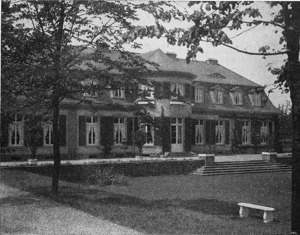
Abb. 1. Landhaus B. bei Hackhausen. Architekt Prof. Paul Schulze-Naumburg. Aus „Deutsche Kunst und Dekoration“. Verlag von Alexander Koch, Darmstadt (siehe unter Literatur).