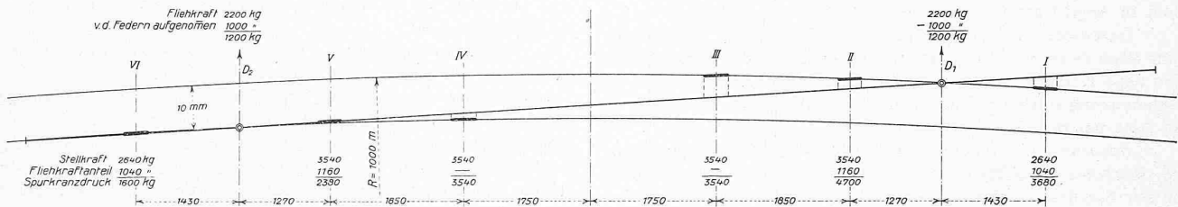
Abb. 30. Kurveneinstellung einer Lokomotive mit Achsfolge nach Abb. 25 und Drehgestellen nach Abb. 27.

Die Achse I läuft schief und hat die gleiche Stellkraft wie oben, also 2640 kg. Dazu kommt der Fliehkraftanteil von 1040 kg, was zusammen einen Spurkranzdruck von 3680 kg ergibt. Die Achse II läuft ebenfalls mit einem Anchnittwinkel, woraus eine Stellkraft von 3540 kg erfolgt; dazu der Fliehkraftanteil von 1160 kg ergibt zusammen einen Spurkranzdruck von 4700 kg. Die Achsen III und IV verhalten sich wie in Abbildung 29. Die Achse V läuft am inneren Schienenstrang an, da der Fliehkraftanteil