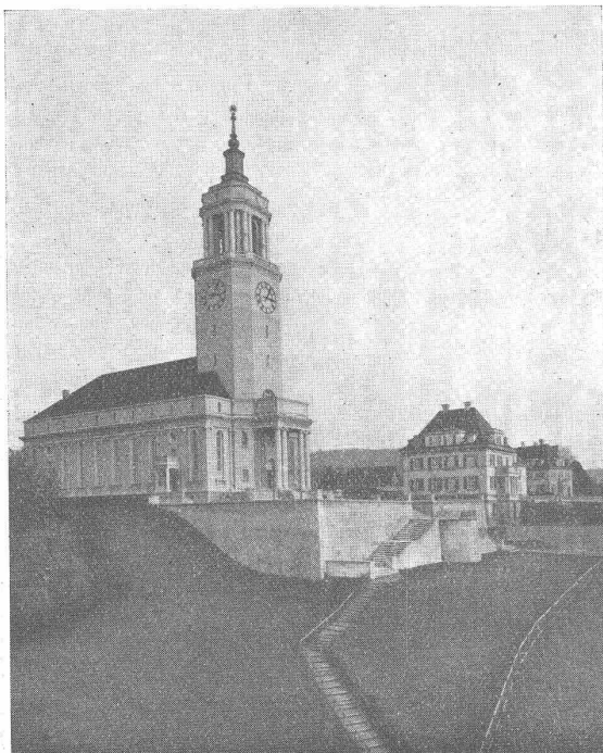
Kirche mit Pfarrhaus in Zürich-Fluntern