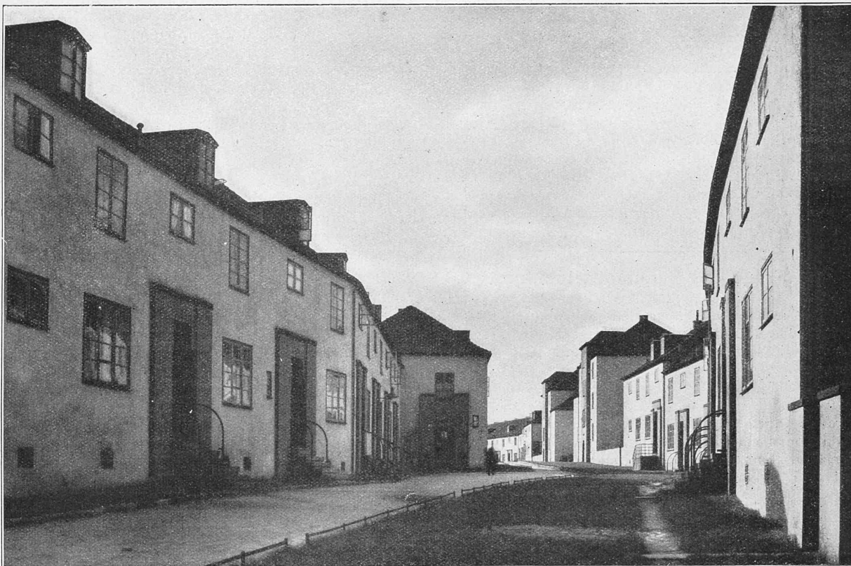
Abb. 3. Aus der Siedlung Essen-Stadtwald von Arch. Jos. Rings. — Die Strasse „Hagelkreuz“, gegen Westen gesehen.

einem erkennbaren Zusammenhang mit den Richtungen der grössten Schubspannung verlaufen und in denen das Material in einer bestimmten Richtung gleitet (schichtenweises, ebenes Fliessen), und Gebiete, in denen die Gleitrichtungen statistisch verteilt sind. Eine Beobachtung, die für diese Annahme spricht, ist die, dass man auf der Oberfläche der Stäbe die Stellen der ersten Fliessfiguren noch später erkennen kann, nachdem sich aus ihnen die breiten, matten Bänder entwickelt haben, während man in diesen selbst oft eine sehr gleichmässige Struktur sieht.