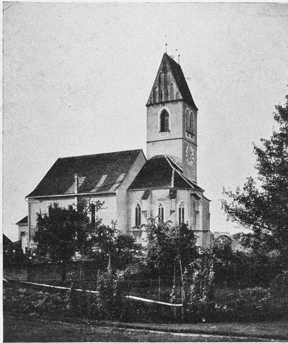
GACHNANG, ST. PANKRAZ

Ich habe vor mir die März-Ausgabe des „Mechanical Engineering“ der American Society of Mechanical Engineers. Das Titelblatt trägt einen Ausspruch unseres weltbekannten Herbert Hoover, Secretary of Commerce. Er lautet: „The Engineer in the world. There is somewhere to be found a plan that will preserve the character of man and yet will enable us to socially and economically synchronize this gigantic machine built out of applied sciences. There is no one who could make a better contribution to this than the Engineer, but to make that contribution our engineers have got to have a broader and stronger place in our world affairs than the have today. The Engineer