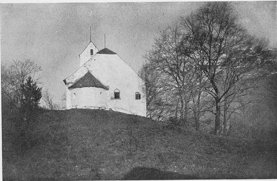
BERSCHIS, ST. GEORG

AUS GAUDY: DIE KIRCHLICHEN BAUDENKMÄLER DER SCHWEIZ, BD. II. — VERLAG ERNST WASMUTH, BERLIN