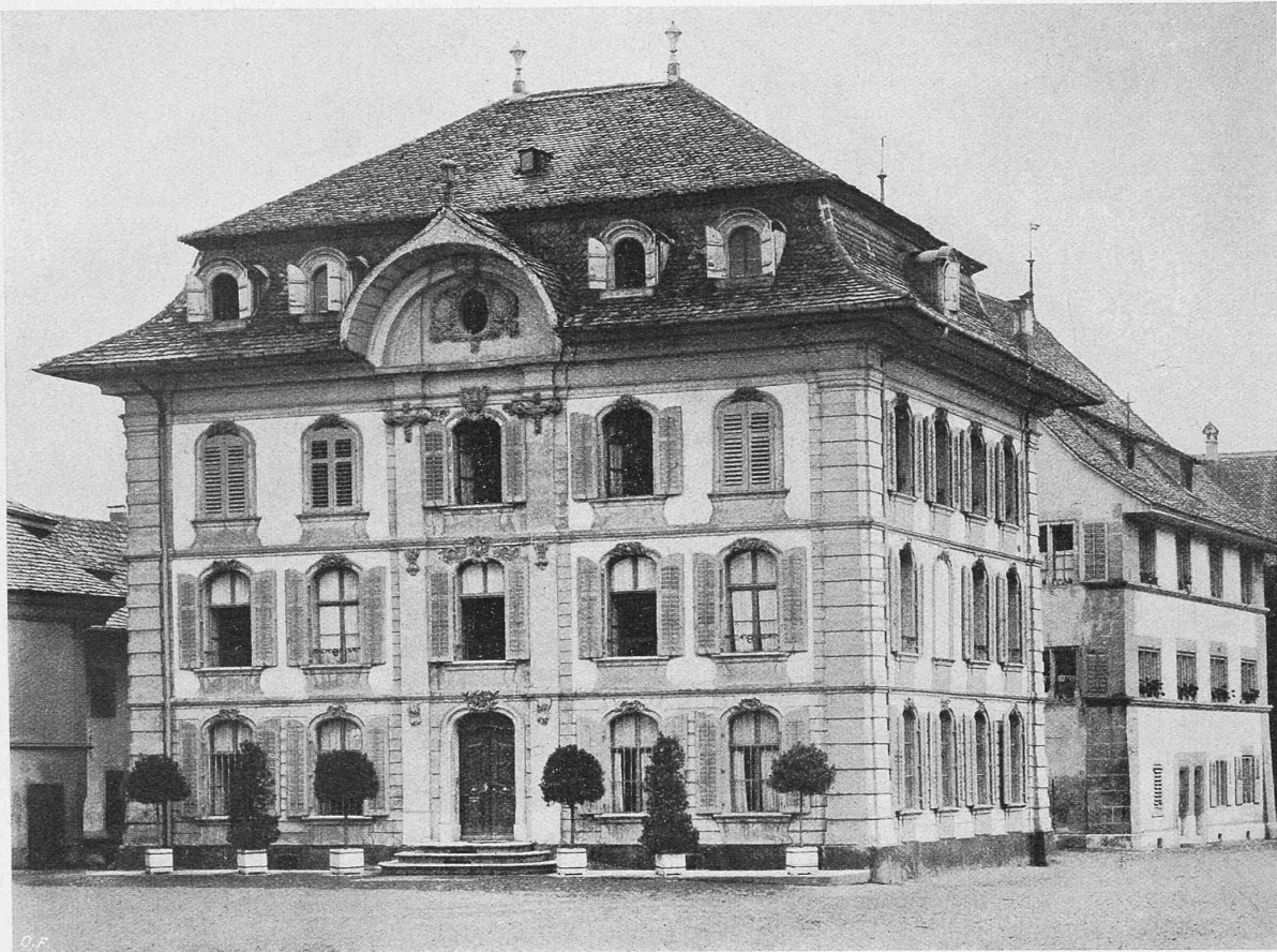
Das „Neuhaus“ in Zofingen, erbaut um 1770 durch Architekt Joh. Jak. Ringier.

alle wichtigern Räume in befriedigende und zweckmässige Form gebracht sind. Weitere Aussetzungen bezogen sich auf die Verkehrswege im Gebäude, auf die Arkaden und auf die Verdunkelung einiger Räume durch letztere.