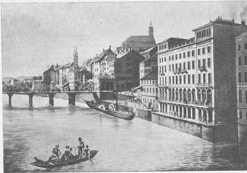
Abb. 1. Die Basler Schiffände vor 80 Jahren. Nach einem alten Stich.