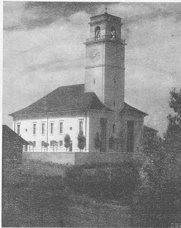
Abb. 2. Ansicht der Kirche aus Südost.

Der Eintritt ins Innere wirkt überraschend, die Tonart ist eine völlig andere: statt dünner Klassizistik herbe Grossartigkeit. Man denkt einen Augenblick an frühchristliche Bauten; nicht dass Einzelheiten kopiert wären, aber die Stimmung ist verwandt: geometrisch einfache Formen, ungliedert glatte Wandflächen, von hochgestelzten Rundbogen durchbrochen, ohne alle Pfeiler- und Kämpfergliederungen, klare, rechtwinklige Verschneidungen, wagrechte Decke; die Einfachheit dieser Formen noch betont durch die Farbe, durch den Gegensatz von Putz und Holzwerk, das zu drei grossen Massen energisch zusammengefasst wird: Gestühl im Erdgeschoss, Brüstung und Gestühl der Emporen, und schliesslich Decke. Die Grosszügigkeit des Raumes ist vor allem eine Folge seiner Eingeschossigkeit; die Pfeiler laufen glatt bis zu den Bogen durch, ohne Rücksicht auf die Emporen, die dadurch als schwebend charakterisiert werden, was von der vortrefflichen Behandlung der Brüstungen noch unterstrichen wird (sie stossen nur mit ihrem obern Profil an die Pfeiler, nicht mit den Seiten).