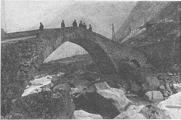
Die „Sprengi-Brücke“ des alten Gotthard-Saumweges in der Schöllenen, die älteste der an der Internationalen Brückenbau-Tagung 1926 besichtigten Schweizer Brücken.