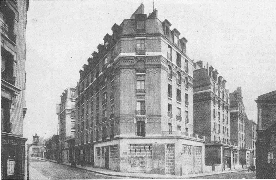
Abb. 2. Pariser Wohnungs-Fürsorge; Rue du Télégraphe (Ménilmontant).

lfd. Bds.) wird Gelegenheit bieten, die Architektur dieser umfangreichen Neubauten noch näher zu studieren. Vergleichsweise sei erinnert an die Wiener Gemeinde-Wohnbauten auf dem „Fuchsenfeld“ in der „S. B. Z.“ Band 84, Seite 19 (12. Juli 1924). Ob die an den „Bauwisch“ (z. B. in den ältern Vorstadtquartieren Stuttgarts) erinnernden klufartigen Einschnitte in den Baublöcken (z. B. Abb. 1) auf öffentlich-rechtlichen Bauvorschriften beruhen, geht aus den Ausführungen unserer Quelle nicht hervor.