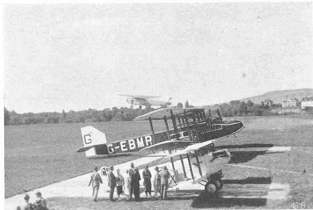
Abb. 2. Einsteige-Perron vor dem Aufnahme-Gebäude.

sich in der Regel mit 600 bis 1000 m begnügen. An diese Rollzone schliesst sich, mindestens wenn sie auf 600 m beschränkt werden musste, eine Schutzzone an, die Ackerland sein kann, aber keine Hindernisse mit Höhenausdehnung besitzen darf; sie dient dem Flugzeug zum Beschleunigen von der Minimalgeschwindigkeit des Abfluges auf die, ein Steigen erlaubende Normalgeschwindigkeit. An die Schutzzone schliesst sich dann die Steigzone an, in der kein Hindernis über eine Ebene vom Winkel 1:40 hinausragen darf.