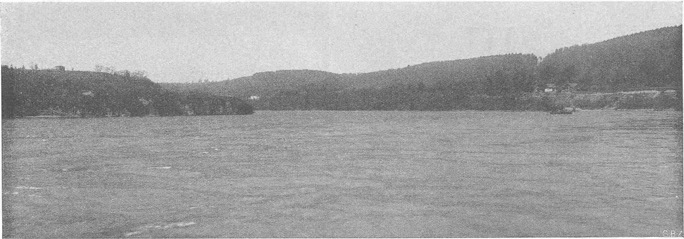
Abb. 3. Die noch unberührte Baustelle, in der Strömungsrichtung des Rheins gesehen. Links Schweizerufer (14. IV. 1927).