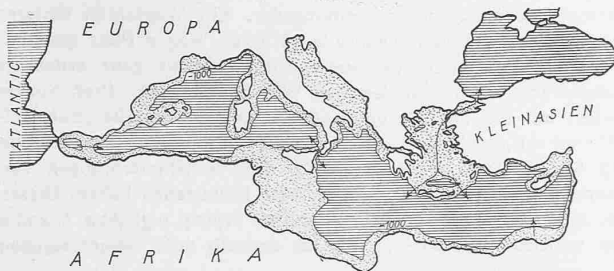
Karte des auf Kote -1000 abgesenkten Mittelmeeres.

Der Architekt Hermann Sörgel (München) übersendet uns ein Projekt „Das Mittelländische Meer als Kraftquelle“, das wir unsern Lesern nicht vorenthalten wollen. Bekanntlich wird das Mittelmeer nur zum geringeren Teil von seinen Süsswasserzuleitungen, zum grösseren durch einströmendes Wasser aus dem Schwarzen Meer und dem Atlantischen Ozean gespeist. Sörgel will nun die Strasse von Gibraltar, die Dardanellen und den Suez-Kanal durch Serien von Staumauern abriegeln; durch Verdunstung müsste dann der Wasserspiegel des Mittelmeeres sinken, wodurch ungeheure Ländermassen trockengelegt würden. Auf der beigelegten Karte ist die Höhenkurve von -1000 eingezeichnet: Italien verwächst durch Verschwinden der Adria mit Dalmatien, Sizilien mit Nordafrika, Griechenland mit Kleinasien usw., die ganze Politik würde umgestellt, und in den Staumauern liessen sich erst noch riesige elektrische Kraftzentralen einbauen.