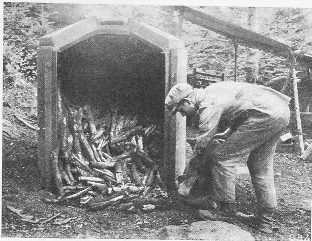
Abb. 3. Entleerung des Ofens nach der Verkohlung.