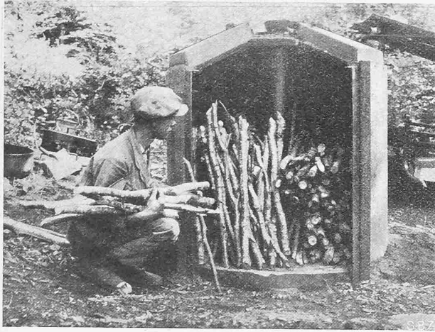
Abb. 1. Aufsichten des Holzes im Ofen.