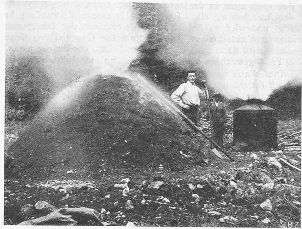
Abb. 4. Vergleichsversuche mit Meiler und tragbarem Ofen.

sind grundsätzlich unabhängig vom Widerstand der Leitung, sie können ohne weiteres auch drahtlos oder mit leitungsgerichteter Hochfrequenz übertragen werden. Jedes dieser Verfahren ist bereits so weit in der Praxis erprobt, dass Einrichtungen zur Fernmessung über grössere Strecken schon auf längere Betriebszeiten, bis zu etwa einem Jahr, zurückblicken können.