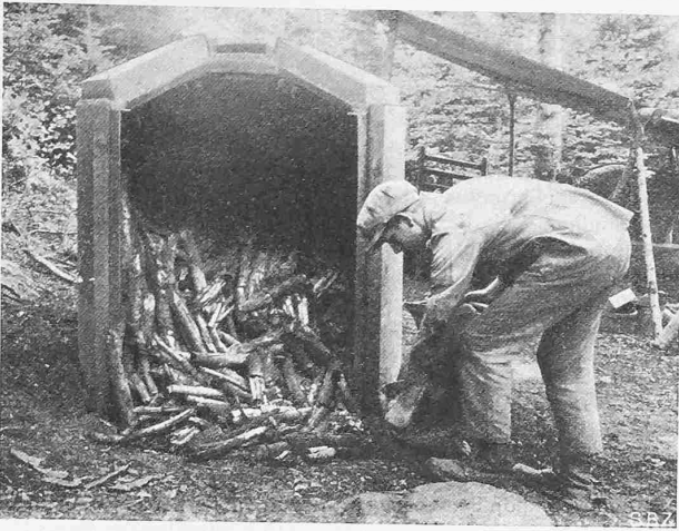
Abb. 3. Entleerung des Ofens nach der Verkohlung.