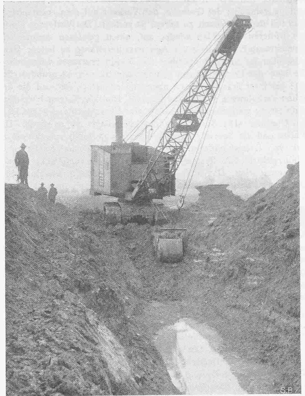
Abb. 2. Die gleiche Maschine als Eimerseilbagger arbeitend.