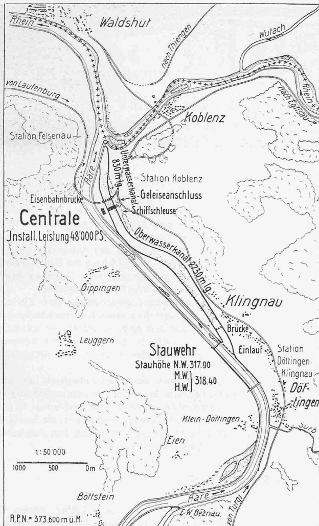
Übersichtskarte des Kraftwerkes Klingnau. — Masstab 1 : 50 000.

zwischen den Widerlagern 125 m. Durch diese reichliche Wehrbreite ist dafür Sorge getragen, dass die Hochwasser wie bis anhin unschädlich abfliessen können.