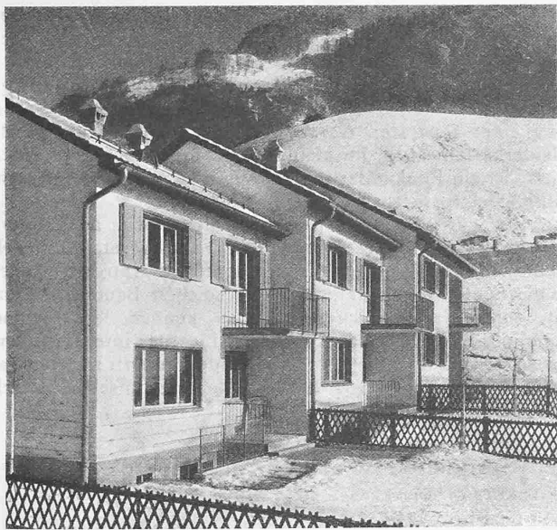
Abb. 6. Vordere Reihe, aus Südwesten.

Holzgebälk, und buchene Langriemenböden über Schrägböden, die Deckenuntersicht besteht im Doppelhaus aus Celotextplatten, in der vorderen Reihe aus Putzdecken. Alle Dächer sind in holländischen Pfannen gedeckt, über Schindelunterzug mit Contrelattung. Heizung: in den vor-