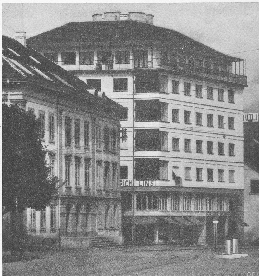
Abb. 7. Geschäfts- und Wohnhaus Burgertor, Luzern. — Arch. A. Meili, Luzern.

zeigt, die fast an Schiesscharten erinnern. Geplant war das nicht, aber die Turmfenster mussten auf Veranlassung der Baupolizei nachträglich bis auf kleine Oeffnungen vermauert werden, um diesen schönen, baugesetzlich aber nicht zulässigen Raum im siebenten Geschoss unbewohnbar zu machen. Hingewiesen sei auch auf die Backstein-Vertikal-Architektur des vor 16 Jahren an der Schöntalgasse erstellten, in Abb. 1 sichtbaren Geschäftshauses 1) , als Zeuge der Wandelbarkeit architektonischen Schönheitsbegriffes.