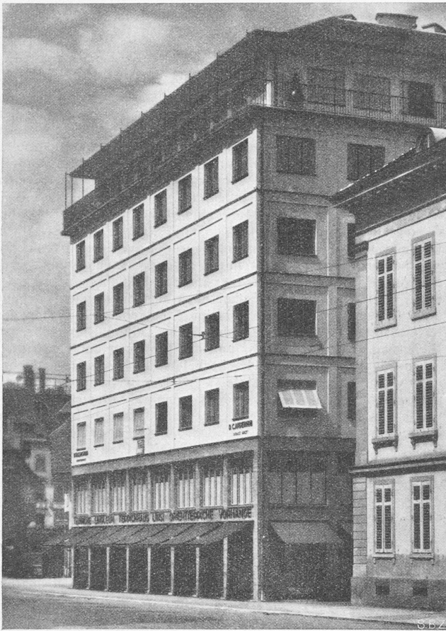
Abb. 6. Haus Burgertor in Luzern.

überdeckt. Eine durchgehende Fundamentplatte erschien aus statischen Überlegungen nicht angezeigt. Die Fundierung hat sich bestens bewährt, indem sich, wie erwartet, nur geringe Setzungen ergeben haben, die zudem praktisch völlig gleich gross geblieben sind sowohl innerhalb der Fassadenfundation als auch unter dem Treppenzylinder, ohne dass zwischen beiden Foundationen irgend eine Verbindung besteht.