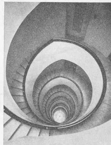
Abb. 9. Tiefblick ins Treppenhaus.