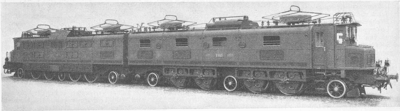
Abb. 1. Ae 8/14 Lokomotive Nr. 11801 für die Gotthardlinie. Ausführung mit BBC-Antrieb. Dienstgew. 244,0 t, Adhäsionsgew. 156,2 t. Dauerleistung 7000 PS bei 61 km/h.