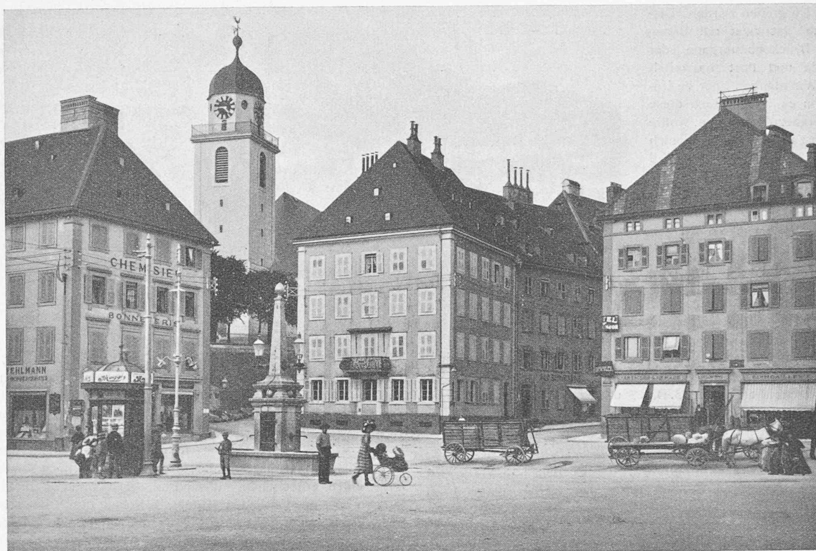
Place de l'Hôtel de Ville à La Chaux-de-Fonds, gegen Nordost, links hinten die (ovale) Stadtkirche.

stellung Aufschluss, von der 60 Millionen Fr. Bundesbeitrag für die Beschleunigung der Elektrifikation abzuziehen sind.