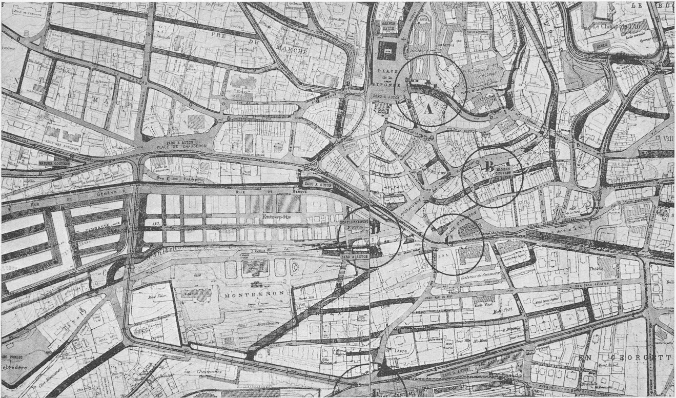
Bebauungsplan-Konkurrenz Lausanne. I. Preis: Architekt M. G. Epitoux, Lausanne. — Gesamtplan-Ausschnitt Masstab 1 : 8000.

Zu beachten: neuer Aufstieg vom Bahnhof (E, Mitte unten) über die Avenue Ruchonnet (links) nach der Place St. François im Zentrum (C), von dieser neuen Verbindung nordwärts abzweigend ein Strassentunnel nach dem Flon-Tal (D) und Place Centrale (zwischen D und B).