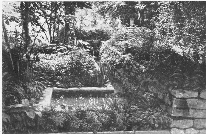
Abb. 7. Ein bewusst gestaltetes Waldmotiv mit Wasser, alten Bäumen und Sträuchern. Feines Naturempfinden ohne Verleugnung der menschlichen Tätigkeit durch naturalistische Spielerei.

Aber auch vom zarten und stillen Leben der kleinen Blumen in den Trockenmäuerchen müsste man sprechen. Oder von der Verhaltenheit der dunkeln Stechpalmen und Buxgruppen. Solcher Ruhe gegenüber erklangen die strahlenden Farben der Stauden- und Sommerflorbeete wie laute Fanfaren. Es brauchte schon den nüchternen Hintergrund der knorrigen Birn-Veteranen — nun zur willkommenen Bass-Stütze der Melodie eingeordnet — damit überbordendes Leben der Zinnien, Phlox, Königskerzen und Asten nicht allzu einseitig die Aufmerksamkeit auf sich ziehe.