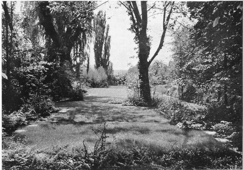
Abb. 5. Blick vom Kastanienplatz über Schatten- und Licht-Partien.

Nicht jede Plastik hält dem Himmel, der Erde und den Bäumen stand. Die Skulpturen von J. Probst waren wie geschaffen, um das Leben dieser Gartenräume in prägnanten Akzenten einzufangen und wieder auszustrahlen. Durch „das schreitende Mädchen“ wurde der Kastanienschattenplatz zum feierlichen Dom, das alte Motiv der „Susanna“ wurde neben dem Wasserbassin zu neuem Ereignis, das „Füllen von Pregny“ gab dem Spielrasen freudigen Bewegungs-Impuls, und die „singenden Mädchen“ brachten Schwingung in die sonnige Sommergartenluft.