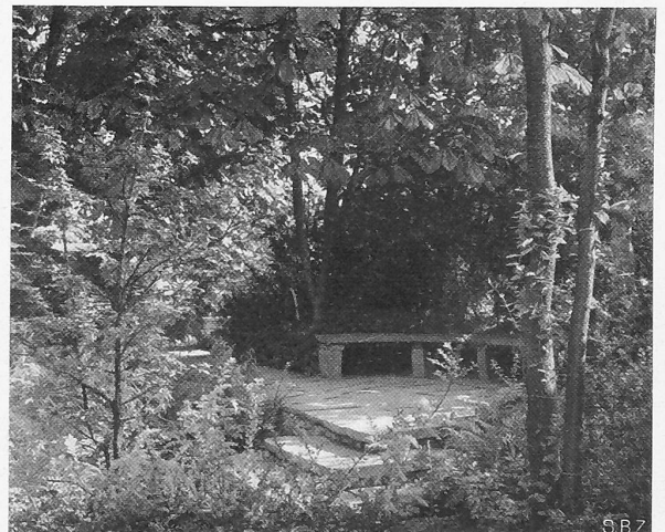
Abb. 3. Sitznische mit Steinbank unter altem Gehölz.

BILDER AUS DEM „ZÜGA“-GARTEN DER GEBR. MERTENS