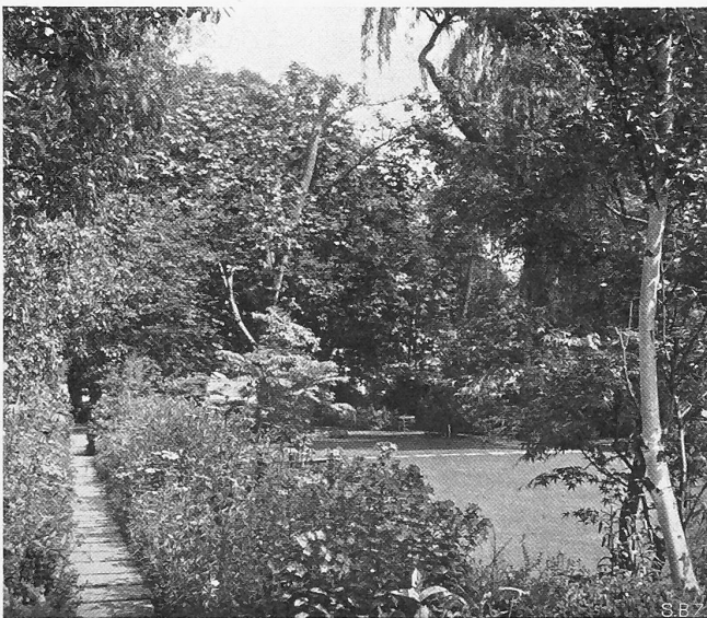
Abb. 2. Plattenweg zwischen Sommerflor-Rabatten im sonnigen Gartenteil.

Die schwingenden Formen der alten Parkbäume wurden zum sprechenden Bild vor ziehenden Wolken am blauen Himmel. Der Unkrautboden reinigte und vertiefte sich — ein feiner Rasen wuchs aus ihm, einladend zum heiteren Spiel —, die hängenden Zweige einer Trauerweide verlangten ein Wasserbassin, und auf der andern Seite straffte sich ein Graben zu einem kleinen Kanal, in dessen stillem Wasser sich die bescheidene Schatten-Vegetation des Waldbodens spiegelte (Abb. 7).