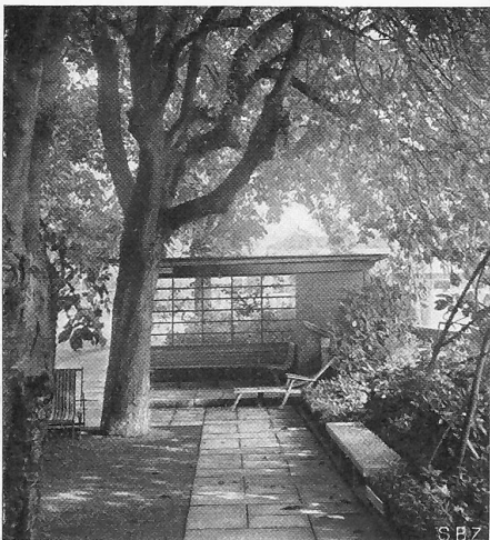
Abb. 6. Kastanienplatz und Gartenhäuschen.