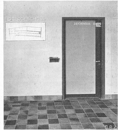
Abb. 23. Normale Stahleltüre.

wurde im Untergeschoss des Altbaues ein Druck-Windkessel eingebaut, wodurch der Druckwasserbehälter im alten Turm überflüssig wurde und der Abbruch des Turmes sich rechtfertigte.