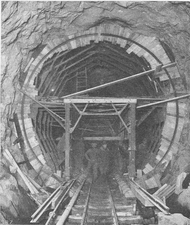
Abb. 13. Eiserne Schalung System Blaw-Knox.