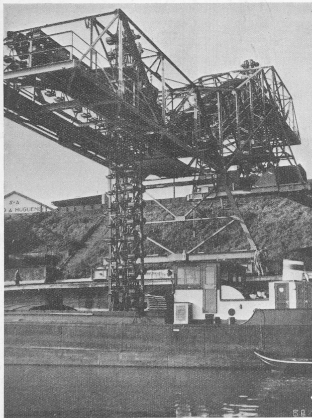
Abb. 3. Gesamtbild vom Rhein aus gesehen.