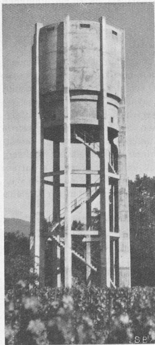
Abb. 4. Wasserturm Chouilly.