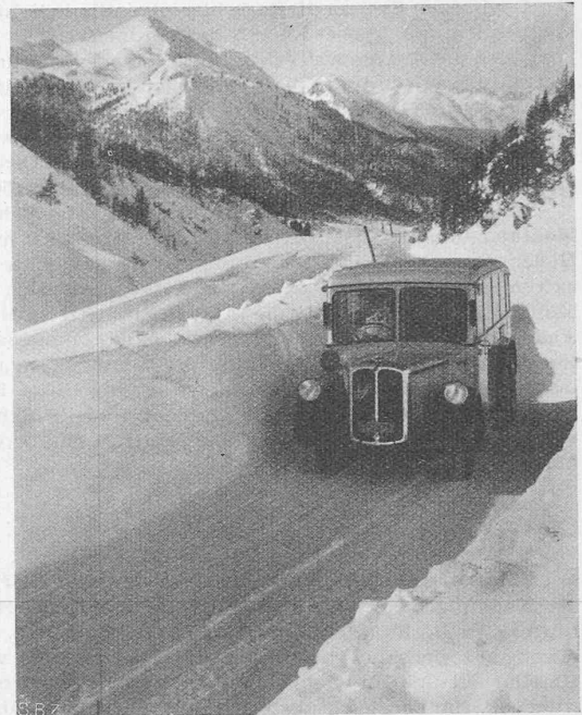
Abb. 7. Julierstrasse, kurz unterhalb Bivio, bei der letzten Arve.