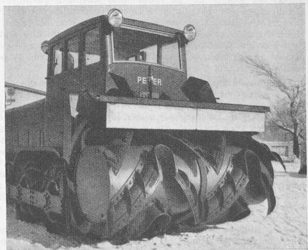
Abb. 5. Seitenansicht der Schneesleuder System Peter (Vertretung Rob. Aebi & Cie., Zürich).