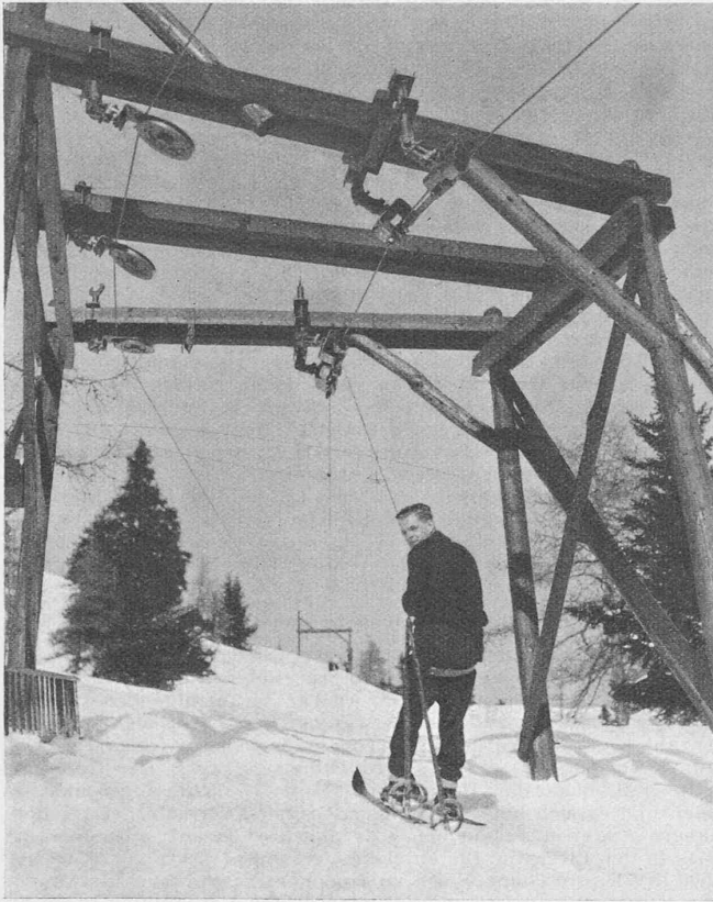
Abb. 2. Skilift System Beda Hefti , Ausführung Oehler & Cie. , Aarau Kurvenführung des Zugseils.

gesamte Projekt sieht ausser der Wiederherstellung des eigentlichen Rathauses im Aeussern Veränderungen im Innern, insbesondere die Schaffung eines zweckmässigen Saales für die Grossratsverhandlungen, die Wiederfreilegung der im Erdgeschoss liegenden Gewölbe, sowie eine bessere Verteilung der im Rathaus untergebrachten Verwaltungsbüreaux vor. In Verbindung mit diesem Hauptteil des Rathauses soll nun, unter Belassung eines Teiles der Räume des alten Nebengebäudes, ein neuer Verwaltungstrakt entstehen, der Staatskanzlei, Staatsarchiv, Drucksachenarchiv in einem Verwaltungsflügel an der Postgasse und einen Archivbau nach der Aareseite zu aufnehmen wird. Die Bausumme für die auszuführenden beiden Flügel beläuft sich auf 1,58 Mill. Fr. Der Bau steht unter der Leitung der kantonalen Baudirektion, unter Zuzug privater Firmen Berns. Mit dem Verwaltungsflügel sind die Architekten Peter Indermühle & Heinrich Daxelhofer in Bern, mit dem Archivbau die Firma von Sinner & Beyeler in Bern betraut.