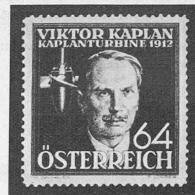
Abb. 2 (rechts). Oesterreichische Kaplan-Briefmarke (1936)

Escher Wyss, Charmilles, Voith, Lauftradurchmesser 7,0 m — Wettingen, 1933, Escher Wyss, verhältnismässig hohes Gefälle 23 m — Marne, Italien, 1935, Charmilles, Gefälle 31,6 m — Vargön, Schweden, Karlstads Mekaniska Werkstad, das grösste Kaplanlauftrad der Welt, Durchmesser 8,0 m.