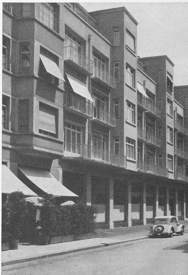
Abb. 1. Appartementhaus «Muralto» Zürich. Arch. H. WEIDELI