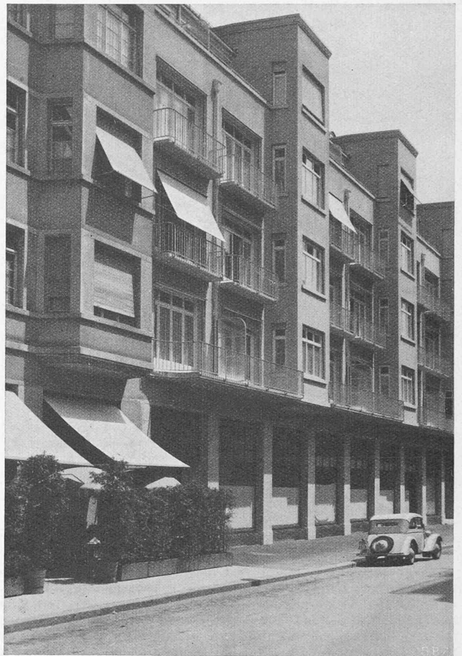
Abb. 1. Appartementhaus «Muralto» Zürich. Arch. H. WEIDELI