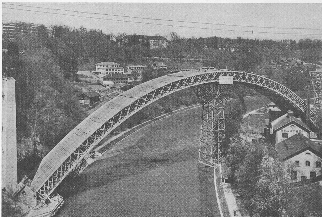
Lehrgerüst der neuen SBB-Aarebrücke in Bern. Stützweite 146,5 m. Erbauer LOCHER & CIE., Zürich Der Gerüstturm in der Mitte diente lediglich zur Montage und ist heute abgebrochen