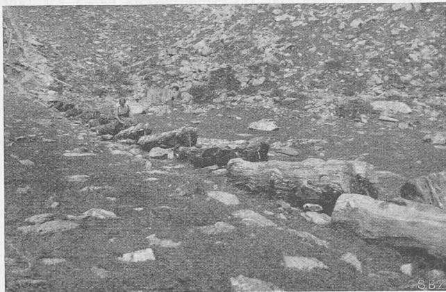
Alte Walliser Viehtränke