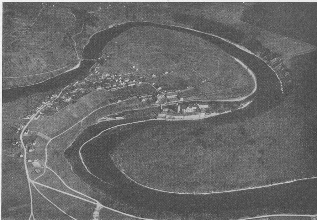
Abb. 7. Flusschleife bei Rheinau, Fliegerbild aus Süden (der Rhein tritt rechts unten ins Bild)

«So wehren wir uns denn heute mit aller Kraft gegen den Versuch, ohne überzeugende Notwendigkeit Kostbarstes und Liebtes im Wunderwerk unserer Heimatbilder zu zerstören, und wir betrachten es als ein erstes Gebot, dass unser Volk sich auflehne gegen ein Geschenk, das es um wertvollen Besitz ärmer macht. Ich denke, dass Sie ohne weiteres mit mir einverstanden sind, wenn ich erkläre: wir können nicht hinnehmen, dass z. B. der Wasserspiegel des Rheinfallbeckens während rund zwei Dritteln