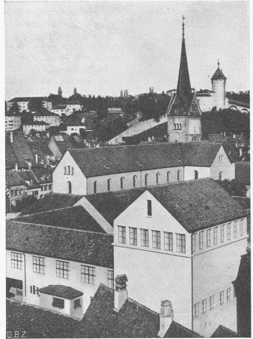
Abb. 2. Aussenansicht (vgl. Bd. 112, S. 217* ff.)

sprechen unseren Erfahrungen und Messungen. Als Beleg übermitteln wir Ihnen Temperaturaufzeichnungen mit einem registrierenden Thermometer im grossen Eckbausaal im Museum zu Allerheiligen. Abb. 1 zeigt die Innenansicht dieses Saales, Abb. 2 die ziemlich ausgesetzte Lage in bezug auf das ganze Gebäude; der Saal besitzt zum grösseren Teil Aussenwände. Bei Beginn unserer Untersuchungen, die sich auf den ganzen Gebäudekomplex bezogen, war die Heizung abgestellt und die Innentemperatur betrug 10^{\circ} C. Sie ist nach Öffnen der Deckenheizkörper innert 4\frac{1}{2} Stunden von 10 auf 17^{\circ} C gestiegen, wobei die Heizwassertemperatur im Mittel um 30^{\circ} C lag. Ohne Steigerung der Heizwassertemperatur ist die Raumtemperatur also im Mittel um 1,5^{\circ} C/h hinaufgegangen. Nach den Mitteilungen aus Holland hätte man die Vorlauftemperatur einige Stunden auf 50 bis 60^{\circ} C steigern müssen, um die Raumtemperatur um 1^{\circ} C zu erhöhen. Unsere Versuche zeigen, dass die holländischen Mitteilungen auch in diesem Punkte schwer verständlich sind. Unsere oben erwähnten Temperaturaufnahmen geben nur die Raumtemperatur, nicht aber die Oberflächentemperaturen. Sicher ist, dass die Deckentemperatur höher war als die Raumtemperatur, während bei Radiatorheizung das Umgekehrte der Fall wäre. Das Behaglichkeitsgefühl im Raum war also grösser als die reine Lufttemperatur vermuten lässt.»