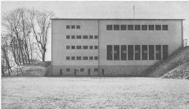
Abb. 4. Nordseite der Turnhalle Rosenberg, Platz auf Kote 434,3 mit den Türen der Fussballclub-Räume. Rechts Treppe zum Spielplatz, links zum Pausenplatz

Aus einem im Jahre 1936 durchgeführten Wettbewerb als Sieger hervorgegangen, hat der Architekt diese Doppelturnhalle unter Ausnutzung des stark gegen Osten abfallenden Geländes (Abb. 1) mit dem 1912 erbauten Rosenbergschulhaus in glückliche Verbindung gebracht. Nicht weniger als fünf Geschosse (Abb. 4) zählt der Kopfbau, der zwischen den vielen verschiedenen Höhenlagen von unterem Platz (434,3), unterer Turnhalle (437,5),