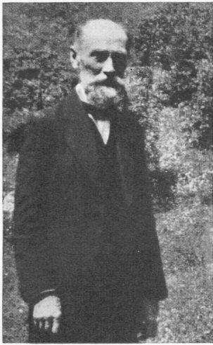
Dipl. Ing. E. T. H. Maurice Koechlin Urheber u. Erbauer des Eiffelturms

am Samstag vor Sechseläuten) nolens volens und ganz natürlich auftraten. — Wer die LA besucht, versäume nicht, anhand des Tagesprogrammes festzustellen, ob er einen der Filme im «Zentralkino» (auf der Höhenstrasse, über der «Anatomie») sehen kann.