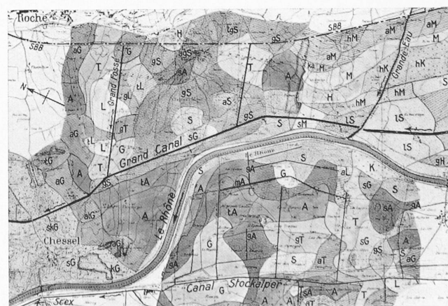
Fig. 2. Coupure (voir fig. 1) de la carte agricole. — 1 : 60 000 Légende: A Argile (a argileux), G Glaise (g glaiseux), S (s) Sable, L (l) Limon, K (k) Gravier, M (m) Marne, H Couche arable (h humifère), T (t) Tourbe