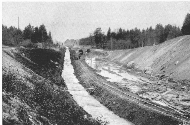
Fig. 5. Le Grand Canal en exécution au Crêt de Chessel

Grösse von 1250 ÷ 3300 m 2 haben, auf. Die einzelnen Grundeigentümer besitzen in der Regel in der gleichen Gemeinde eine ganze Anzahl von Grundstücken, die in vielen Fällen bis auf 100 und mehr ansteigen kann. Eine noch stärkere Parzellierung besteht in den Gebirgskantonen Wallis, Tessin und in den Tal-schaften Mesocco, Calanca und Bregaglia des Kantons Graubünden. Hier fallen auf 1 ha 15 ÷ 50, in gewissen Gegenden sogar 50 ÷ 150 Grundstücke, deren Flächeninhalte zwischen 670 und 70 m 2 wechseln. Grundeigentümer mit mehr als 100 Parzellen sind in diesen Gegenden keine Seltenheit. Im Bleniotal des Kantons Tessin gibt es viele Eigentümer, die sogar 800 ÷ 1200 Grundstücke besitzen.