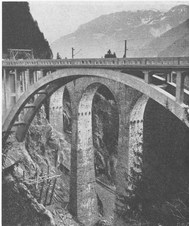
Abb. 3. Neue Strassenbrücke neben dem Viadukt der Rhät. Bahn talauswärts gesehen

Die Lage der neuen Brücke zwischen der alten Holzbrücke und dem Viadukt der Rhätischen Bahn war gegeben. Je mehr die neue Brücke sich dem Eisenbahnviadukt näherte, desto besser gestalteten sich die Kurvenradien der Anschlüsse; man einigte sich deshalb auf einen Abstand der äussersten Teile der beiden Brücken von 4 m.